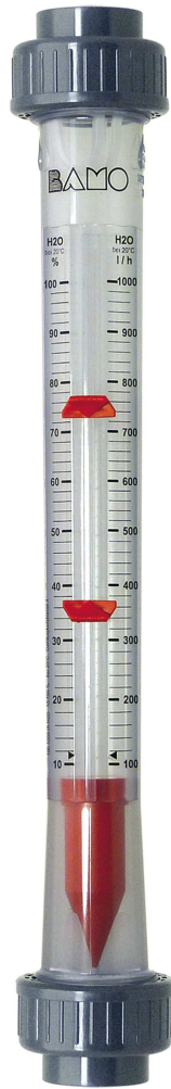
IDP non inclus