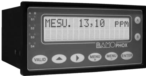
Boîtier Encastrable (de base)