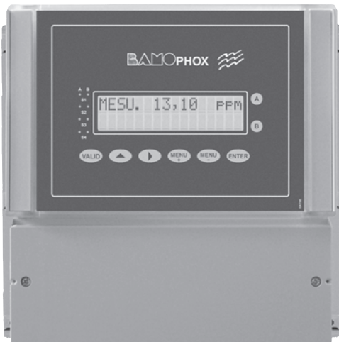
Boîtier Mural (de base)