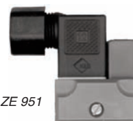
Contact ZE 951

Pouvoir de coupure : Maxi 10 VA / 230 V AC / 0,5 A Fonction : Par absence de débit (Bistable NO , Code P48 119) : Par absence de débit (Bistable NF , Code P113 131) Protection : IP 65 - Bornier débrochable DIN EN 175301-803 Température ambiante : 0...+55 °C Température fluide : 0...+55 °C