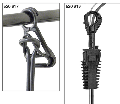
Accessoires : Attache câble