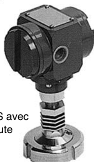
Raccord SMS avec extension haute température