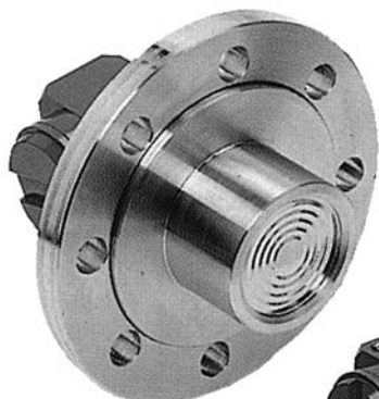
Bride avec extension