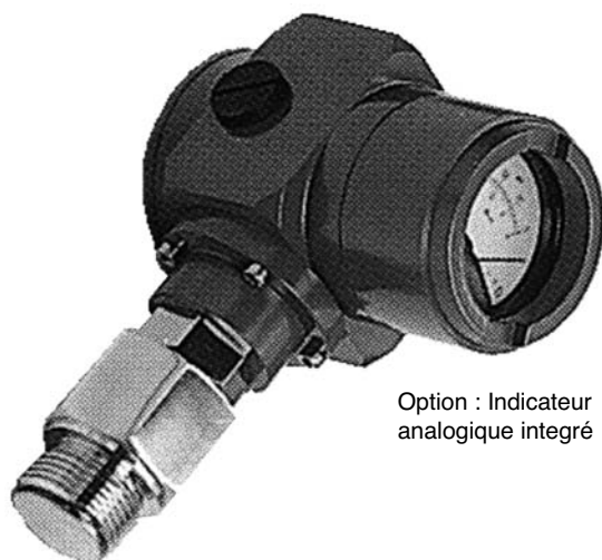
Option : Indicateur analogique intégré