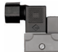
Contact ZE 951