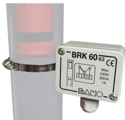
BRK 60 / SFA