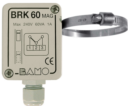
BRK 60 / MAG