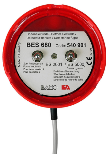
Vue du dessous