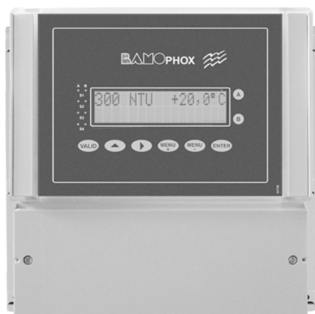
Boîtier Mural (de base)