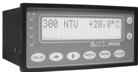
Boîtier Encastrable (de base)